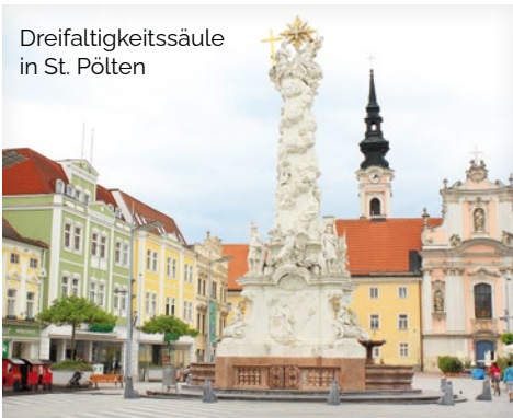
Dreifaltigkeitssäule in St. Pölten

NACHMITTAG Die Schülerinnen und Schüler erleben die Altstadt im Rahmen einer kindgerechten Führung. Viele spannende Erzählungen erwecken die Geschichte unserer Landeshauptstadt zum Leben.