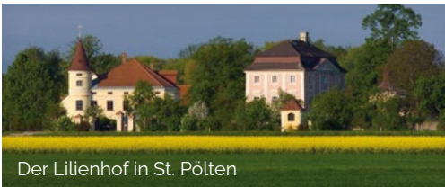
Der Lilienhof in St. Pölten

Flusswanderung Waldpädagogik Nachtgeländespiele