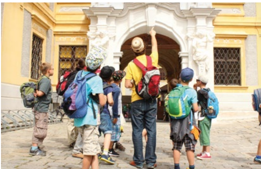
Dürnstein in der Wachau

ABEND Wir organisieren für euch eine aufregende Kinderdisco , bei der sich die Mädchen und Burschen so richtig austoben können.