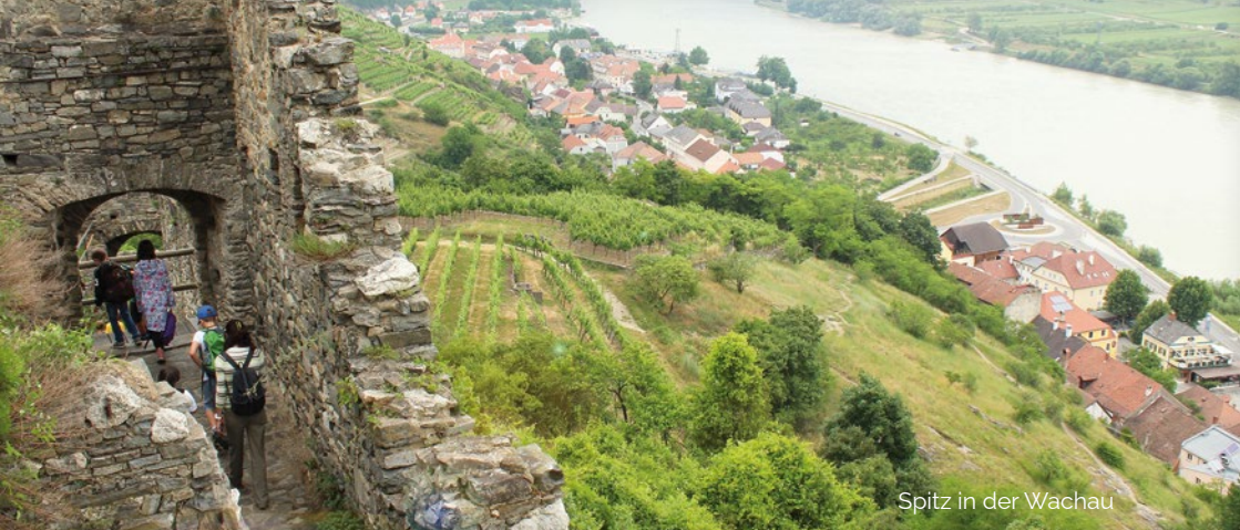
Spitz in der Wachau